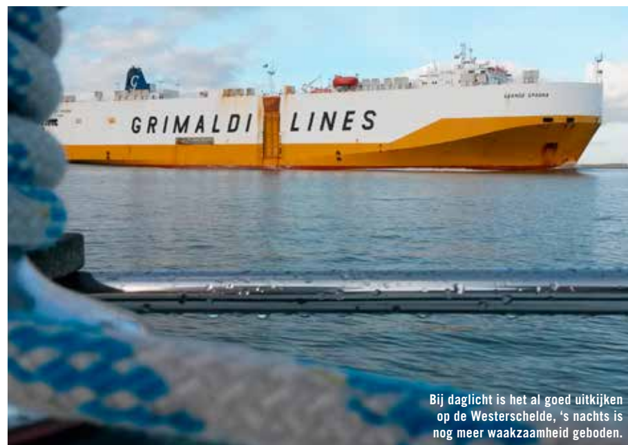
Bij daglicht is het al goed uitkijken op de Westerschelde, 's nachts is nog meer waakzaamheid geboden.