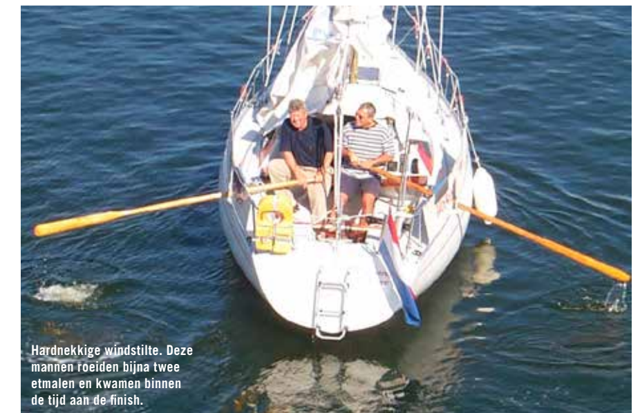
Hardnekkige windstilte. Deze mannen roeiden bijna twee etmalen en kwamen binnen de tijd aan de finish.

Tegen zonsondergang vaart de vloot uit, al direct in verschillende richtingen.