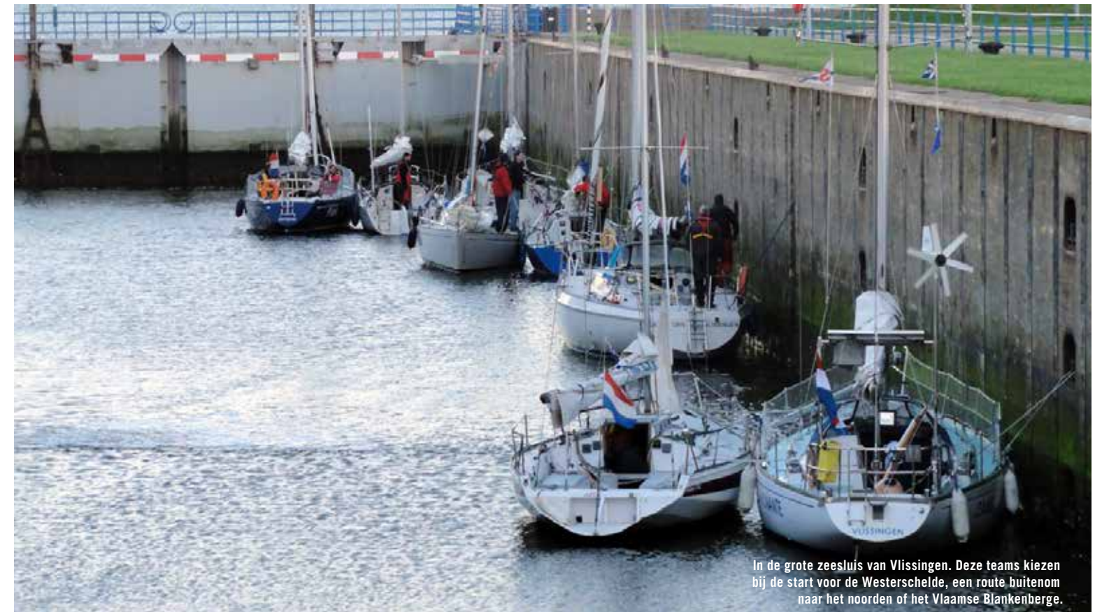
In de grote zeesluis van Vlissingen. Deze teams kiezen bij de start voor de Westerschelde, een route buitenom naar het noorden of het Vlaamse Blankenberge.